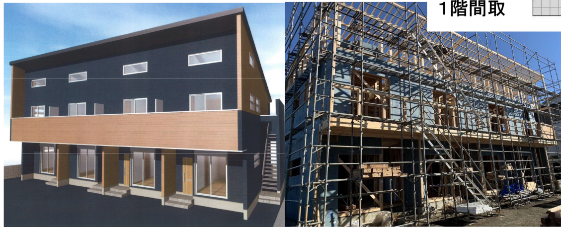
※写真は11/22撮影したものととなります。